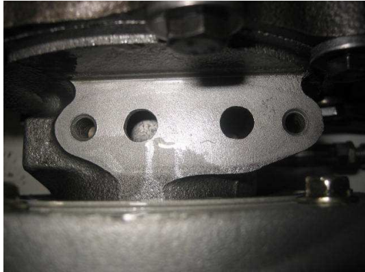
Cartouche avec liquide de refroidissement (A)

Il peut arriver que sur le nouveau turbo, le noyau central ne dispose pas de la cartouche en question et que le logement présente un aspect comme sur la photo ci-dessous (photo B).